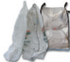
Big bags de produits fertilisants, semences et plants