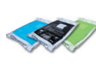
Sacs de produits fertilisants