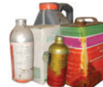
Produits Phytophar- maceutiques Non Utilisables