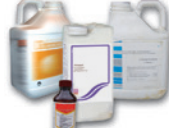
Bidons en plastique de produits phytopharmaceutiques et oligo-éléments