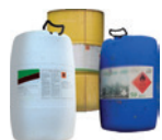
Fûts de produits phytopharmaceutiques et oligo-éléments

Attention, ces produits ne sont pas collectés par les déchetteries. Ils sont récupérés par votre distributeur