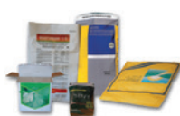
Sacs, boîtes et bouchons de produits phytopharmaceutiques et oligo-éléments